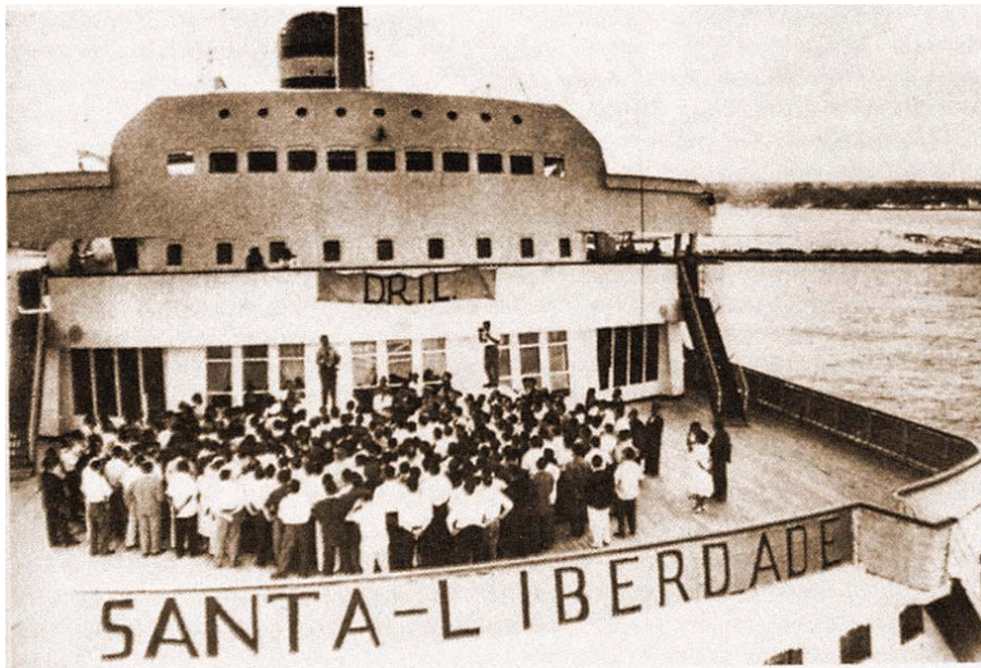
O rebautizado polo DRIL como 'Santa Liberdade', 1961.

Está fóra de dúbida que Xosé Velo foi o cerebro do DRIL, a súa alma, e Galiza e os dereitos das nacións sen Estado, o seu corazón. Custa crelo ao contemplalo expulsado por unha dirección en Venezuela que non entendeu que o DRIL sen Velo non era nada.